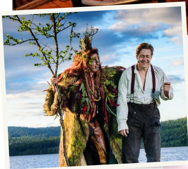
PEER GYNT OG FJELLKONGEN: Henrik Ibsen reiste gjennom Gudbrandsdalen i 1862, og ble inspirert til å skrive Peer Gynt.