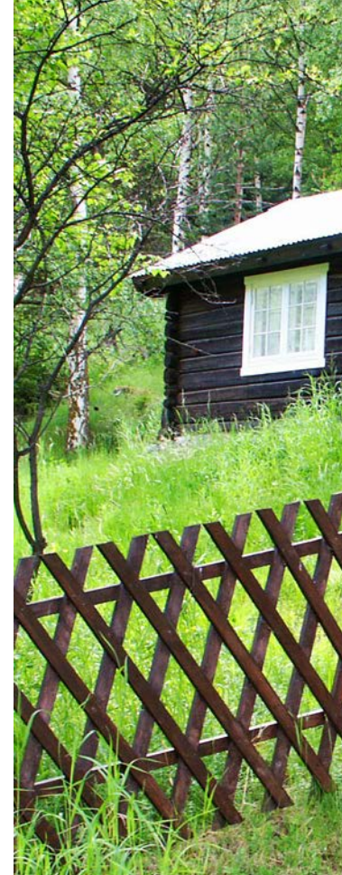
I BØKENES VERDEN: Arbeidsrommet til nobelprisvinner Sigrid Undset på Lillehammer.