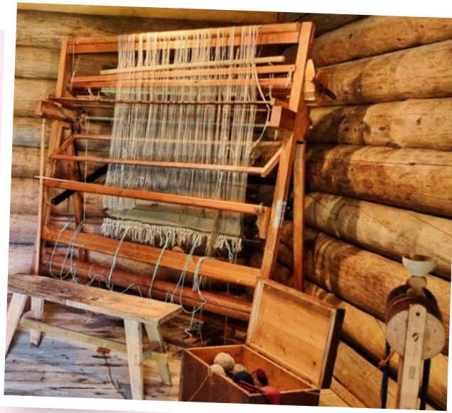
HEKNEVEVEN: I stabburet på Ringebu prestegård kan du gå på oppdagelsesferd i Lars Myttings bokunivers.

Er du blant dem som har kost deg med Lars Myttings historiske romaner Søsterklokkene og Hekneveven de siste årene? Eller kanskje er du bare nysgjerrig på bøkene hans? Ta turen til Ringebu, og se hvor forfatteren har hentet inspirasjonen! Besøk den vakre stavkirken og prestegården, som begge spiller en viktig rolle i den frodige fortellingen. Bøkene bygger på det gamle sagnet om «Systoklukkon» i Ringebu stavkirke, og handlingen er lagt til slutten av 1880-årene, en tid preget av sorg og slit, dramatikk og kjærlighet, myter og overtro. Mens leserne venter spent på den siste boken i trilogien, kan besøkende til Mytting-utstillingen i Ringebu prestegård gjenoppfriske de to første, høre ham lese fra Søsterklokkene og bli bedre kjent med hele forfatterskapet.